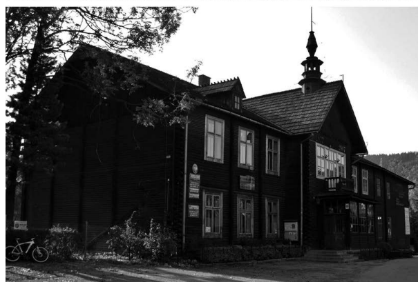
Budynek Zespołu Szkół Budowlanych w Zakopanem kiedyś i współcześnie

wszystko, co najbardziej wartościowe w polskim budownictwie drewnianym i dlatego został uznany za polski narodowy styl budowlany. Głównymi wykonawcami budowli w stylu podhalańskim byli wychowankowie szkoły. Styl zakopiański królował nie tylko na Podhalu, ale powstawały również w tym stylu wille w Warszawie, stacje kolejowe na Wileńszczyźnie.