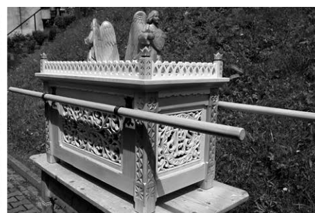
Modele wykonane przez uczniów w warsztatach szkolnych: budynek regionalny i arka przymierza, przekazana papieżowi Franciszkowi podczas Świątowych Dni Młodzieży w Krakowie